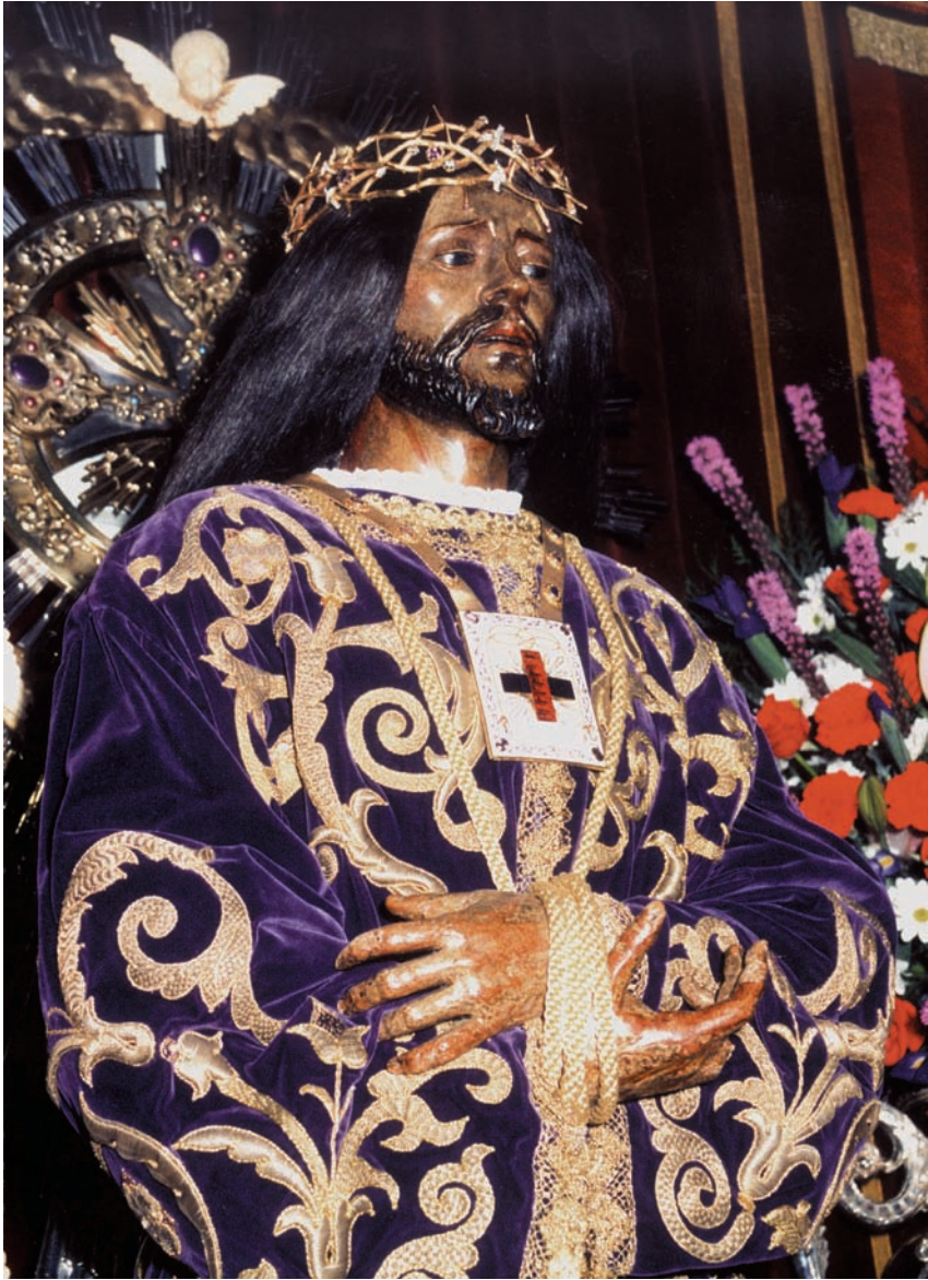
..... Nuestro Padre Jesús, bella talla del siglo XVII