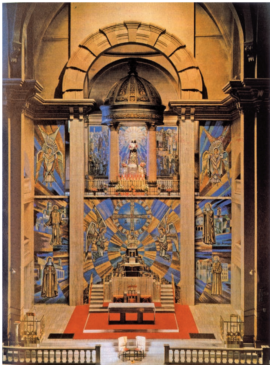
..... VISTA GENERAL DEL PRESBITERIO DE LA BASÍLICA, CON LA IMAGEN DE N.P. JESÚS NAZARENO